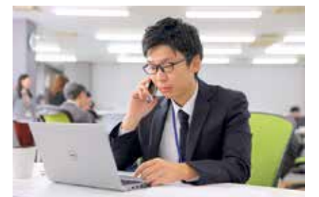
自らの意思で集中できる環境を作れるフリーアドレス。場所を変えることで気分転換もできる。