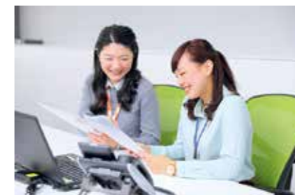
初めて携わる仕事であっても、先輩の隣に座れば指導を受けられるのもフリーアドレスのメリット。