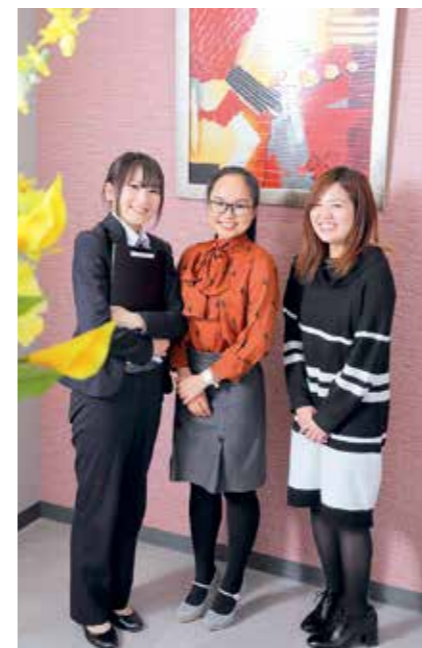
プライベートでも仲がいいという女性社員たち。仕事以外の話題に花が咲くことも多いという。