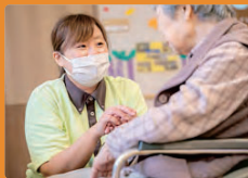
意欲的な職員を応援してくれる職場

専門学校で医療事務を学んだ後、看護補助として「中嶋病院」に入職しました。食事介助やシーツ交換といった業務をする中で、「もっと入院されている方に寄り添ったケアをしたい」と、実務者研修の資格に挑戦。上司には、「スキルアップをして高齢者福祉施設で働きたい」と伝えていたので、資格取得後はすぐにグループの介護老人保健施設へ異動することができ、さらに勉強をして介護福祉士の資格を取りました。看護補助をしていたおかげで利用者のちょっとした体調の変化にも気づくことができ、入職してからのすべての経験が今に活きていると感じます。まずは、介護福祉士として一人前になって、将来的にはケアマネジャーや支援相談員へのステップアップも考えています。