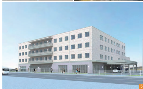
1 東仙台エリアに位置し、地域のシンボルにもなっている「中嶋病院」。医療の進歩に対応した質の高い治療と温かなサポートで、地域のの人に愛されている。院内には「介護老人保健施設 けやき」もある。2 「介護老人保健施設 メープル小田原」では、早期の家庭復帰を目指し、利用者の暮らしをサポート。3 毎年12月には、イルミネーションで地域に温かい光を灯している。4 岩切にある「介護老人保健施設 コジクア・ホーム」。自然にあふれた「cozy」（＝居心地のいい）な場所で自立復帰を目指す。5 2022年4月に誕生予定の「care NI」は、これまで展開してきたグループの力を結集させた新しい福祉施設。