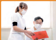
仲間同士で助け合っています

私の仕事は、診断書の作成や診察記録の入力といった医師の事務的な作業の補助を行う「医師事務作業補助」。診療は医師にしかできませんが、私たちがサポートすることで、医師と患者さまが向き合う時間を増やしています。私の場合、看護補助として入職し、外来を経験したのち今の部署に配属。11名いる仲間の中には、医療とは関係のない仕事から転職した人もいますが、この職種は資格がなくても大丈夫。院内外の研修があり、経験を重ねて知識を身につけられます。また、ここは女性が働きやすい職場です。私自身、子育てをしながら働くママ。院内保育園のおかげで待機児童の心配もなく、育児休暇中は子育てに集中できました。育児だけでなく、家族の介護をしている人も安心して働ける環境があります。