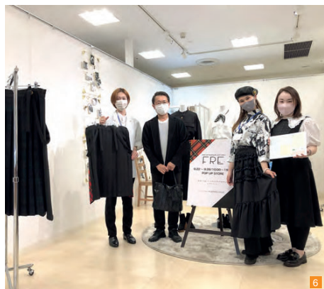
6 学生支援の様子。SDGsをテーマにしたアコーディオンプリーツスカートの加工をお手伝いし、作る責任の役割と大切さを学生と共に分かち合った。

高度な加工技術を武器に世界中に感動を届ける プリーツとは婦人服によく見られる技術で、布をひだ状に加工したもの。身体に布を沿わせ動きやすくしたり、装飾を目的につけられたりする。そのプリーツ加工を主体に、婦人服の一貫製造を行っているのが、蔵王町にある『白石ポリテックス工業』だ。経営理念は「プリーツで世界中の人々に感動を届けます」。経営方針には「開拓と品質へのこだわり」「お客様への喜び」「社員の幸せ」の3つを掲げ、「1. 技術を進化させ、技能を伝承する」「2. プリーツにこだわり、お客様にご満足していただく」「3. 良いものを作り、人生を幸せにする」の行動方針のもと、プリーツ加工のエキスパートとして常に挑戦を続けている。蓄積された技術は、メーカーの求める複雑なプリーツデザインにも対応可能。丁寧な手仕事の技と多彩な専用機械を駆使して仕上げる同社のプリーツは、その価値が認められ、日本を代表する世界的ブランドのコレクションにも多数採用されている。