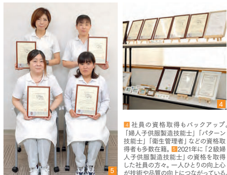
4 社員の資格取得もバックアップ。【婦人子供服製造技能士】「パターン技能士」「衛生管理者」などの資格取得者も多数在籍。5 2021年に「2級婦人子供服製造技能士」の資格を取得した社員の方々。一人ひとりの向上心が技術や品質の向上につながっている。

制作やショップ企画の支援を通して、SDGs（つくる責任、つかう責任）への取り組みを推進。学生支援が優秀な人材の採用に結び付くという好循環も生み出している。地域や社会に寄与する活動もまた、健康経営の一環であり、企業価値の向上や社員の人的成長につながるもの。働きやすい環境を整え、社員の人生を豊かにしながら、プリーツ加工企業日本一を目指す『白石ポリテックス工業』。興味を持った人はぜひコンタクトを取ってみよう。