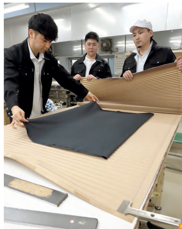
3 斬新なハンド型のアイデアが世界的コレクションに採用されるなど、若手の活躍が著しいハンドプリーツチーム。