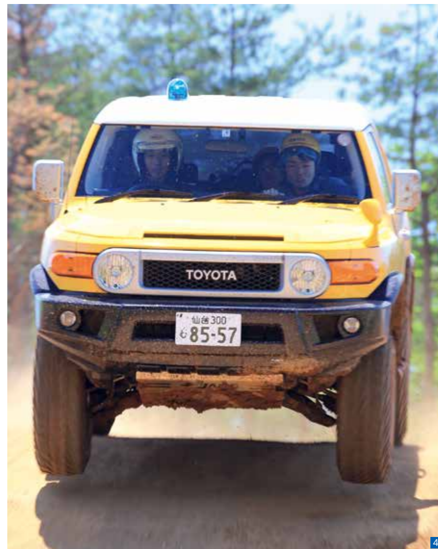
4 毎年開催の「四駆まつり」は迫力満点。本格四駆車でモトクロスコースを走行。