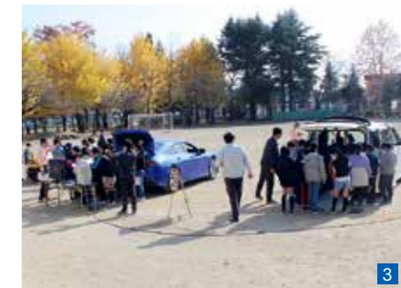
1 『スポーツランドSUGO』で開催する「モーターフェスティバル」。サーキットコースの試乗車走行、スラムショーなどでファンを獲得。2 世界3大カスタムカーショーの一つ「東京オートサロン」に宮城県の販売店が唯一、毎年出展。3 地域貢献推進室による小学5年生を対象にしたクルマの出張体験授業。