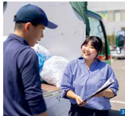
2 スーパーの店舗前に設置しているリサイクルステーション。買物ついでに古紙を持ち込むことができ、特に主婦層に人気。 3 回収作業には常時100人を超える社員が従事している「サイコー」。打合せも綿密に行われている。