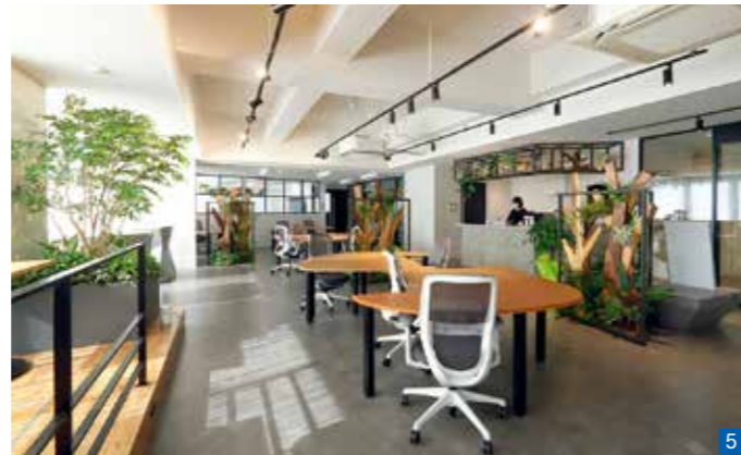
1 学生との距離感が近づくよう、一方的な説明ではなく、社長や先輩社員との対話を重視した就活イベント「Links」。2 仕事に対する決意を表明することで、業務に関するスキルや人間としての成長も高められる「ジリキ研修」。キャリアアップにも繋がる。3 4 「定禅寺ベース」はペットボトルからできた椅子やランプシェードなど、リサイクル素材を活用したインテリアで彩られている。5 社会課題の解決に向けて、地元企業のほか、フリーランスや学生などが集い、新たな価値の創造が期待されている「IDOBA」。