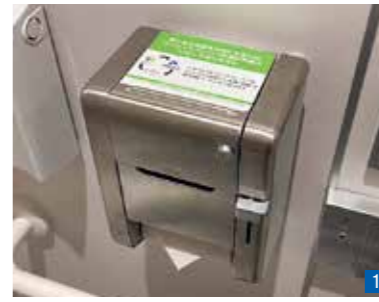
1 エスバルの店舗から出る分別された紙類を使い、トイレトペーパーを製造。エスバルのトイレに設置している。