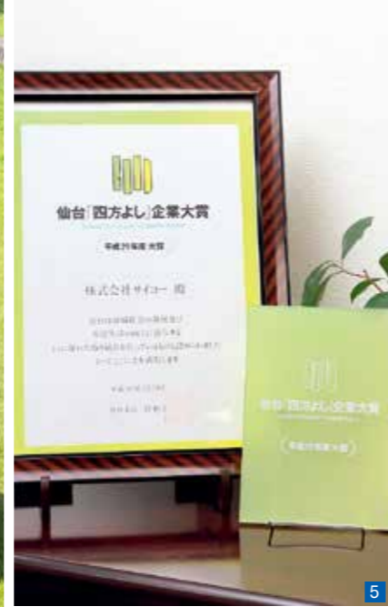
5 「売り手よし」「買い手よし」「世間よし」「働き手よし」が評価基準の「四方よし」企業大賞を受賞している。 6 気さくな雰囲気です社員に話しかける齋藤 孝志社長。親しみやすい人柄で愛されている。